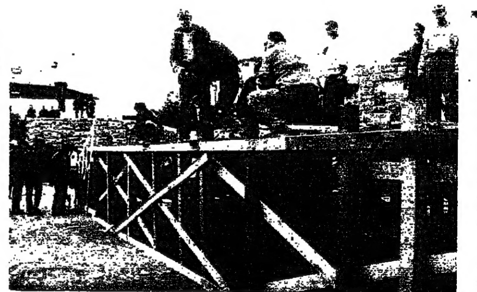
القاعة مسرح عند مدخل القصر